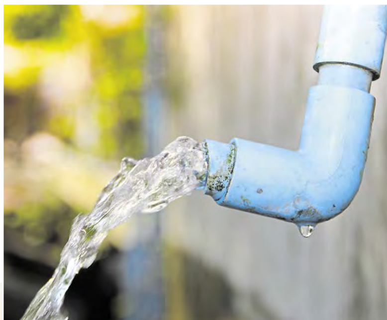
Wasser aus einem altem PVC-Rohr

Schützen Sie Ihre Installationen mit einem hochwertigen und zuverlässigen Schutzfilter. Nicht umsonst ist der Einsatz eines solchen Filters Pflicht und von den entsprechenden Normen vorgeschrieben.