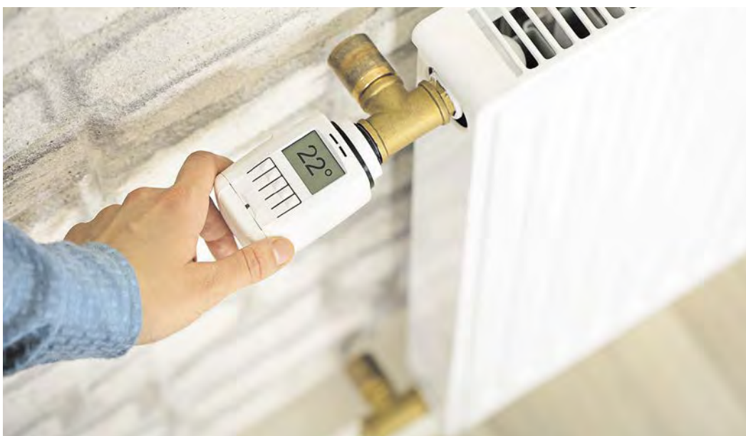
Richtige Einstellung des Thermostaten an der Heizung ist im Winter besonders wichtig.